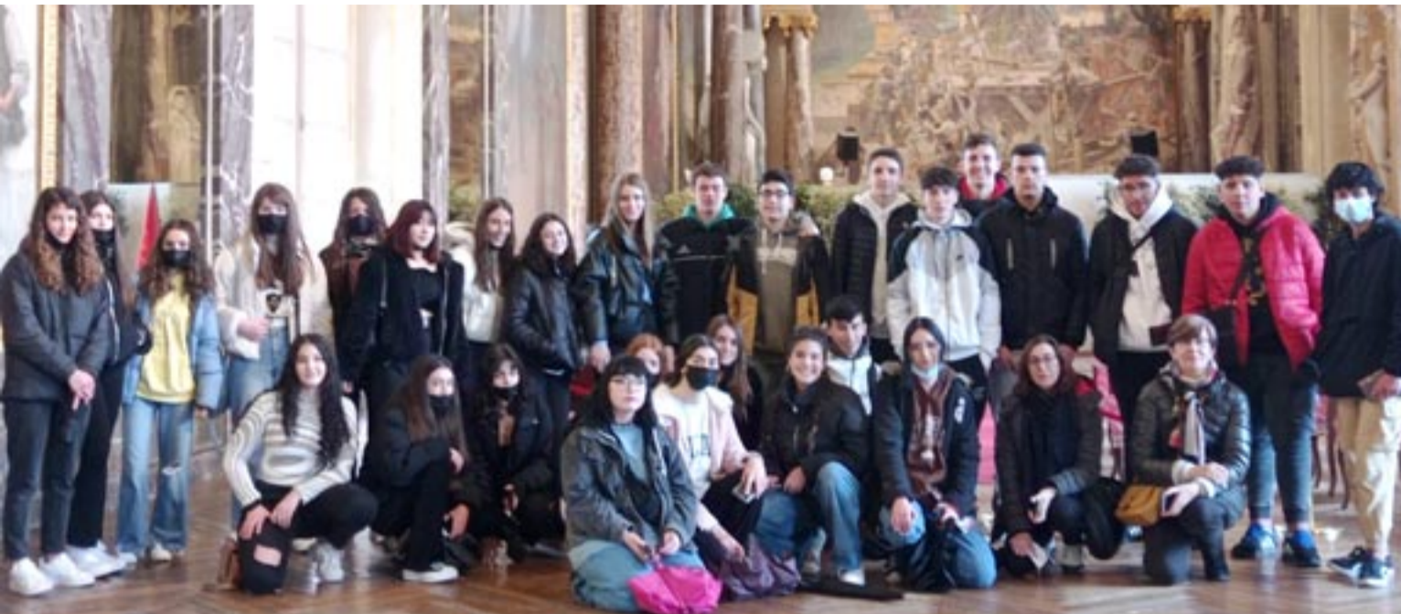
Alumnos del IES Vega del Turia de Teruel en un viaje a Toulouse el curso pasado